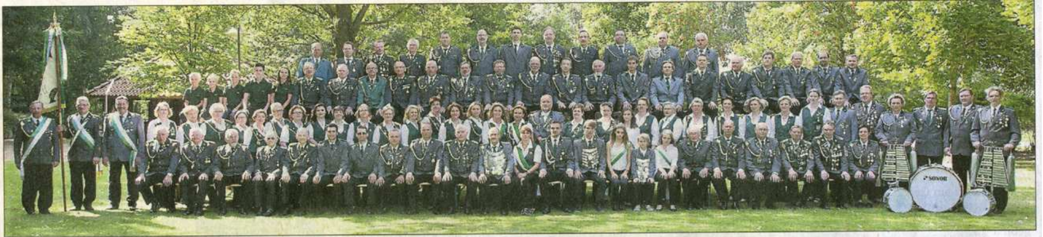
Anlässlich der 125-Jahr-Feier und der dazu erscheinenden Festschrift hat sich der Schützenverein Beckstedt auf einem Erinnerungsfoto ablichten lassen.