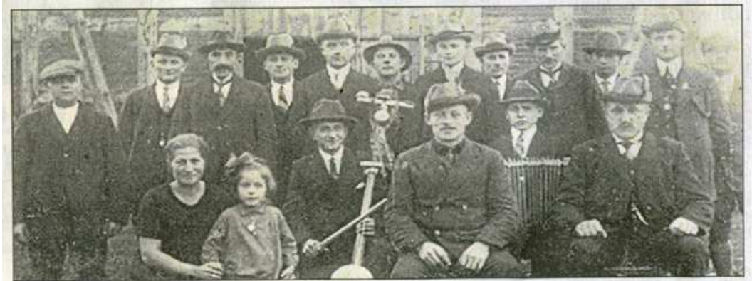
Aus dem Jahr 1929 stammt diese Aufnahme aus der Historie des Schützenvereins Beckstedt.

Anfangs befand sich der Schießstand im Gasthaus Rövekamp, dem ursprünglichen Vereinslokal. Dort feierten die Beckstedter Grünröcke auch die ersten Schützenfeste. Der Orkan vom 13. November 1972 zerstörte den Schießstand völlig. Daher war es