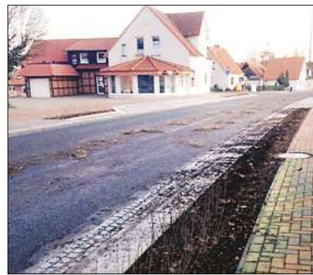
Trauriges Bild: Herausgerissene Pflanzen lagen am Dienstag auf der Ortsdurchfahrt.

Wer die Ortsdurchfahrt am Dienstagmorgen passierte, sah auf einem Teilstück keine Pflanzen mehr in den schmalen Beeten, dafür lagen sie auf der Straße verteilt.