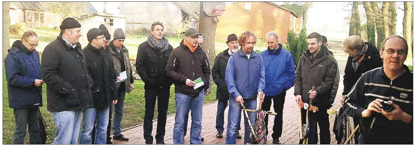
Mit der Teufelsgeige unterwegs: Die Männer aus Austen überbrachten überall im Ort musikalische Neujahrsgrüße. Das Liedgut fanden sie in der in diesem Jahr neu erstellten Liederfibel. (kleines Bild)

TRADITION Austener Männer überbringen musikalische Grüße an viele Bürger