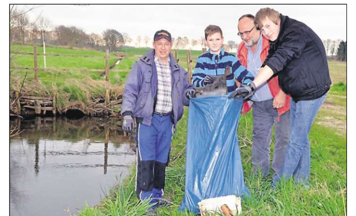
Gemeinsam befreiten die Mitglieder des Fischereivereins Colnrade das Hunteufer vom Müll.

re) mitgenommen hat. Sie waren das erste Mal bei dieser Aktion dabei und zeigten sich darüber verwundert, was die Menschen alles in der Natur entsorgen. Am Ende zeigte sich, dass die Helfer den zehn Kubikmeter große Müllcontainer bis zur Hälfte mit Müll beladen hatten. Nach der Einschätzung von Fischereivereinsvorsitzenden Dieter Klirsch wurde dieses Mal mehr gesammelt als im Vorjahr. • jfb