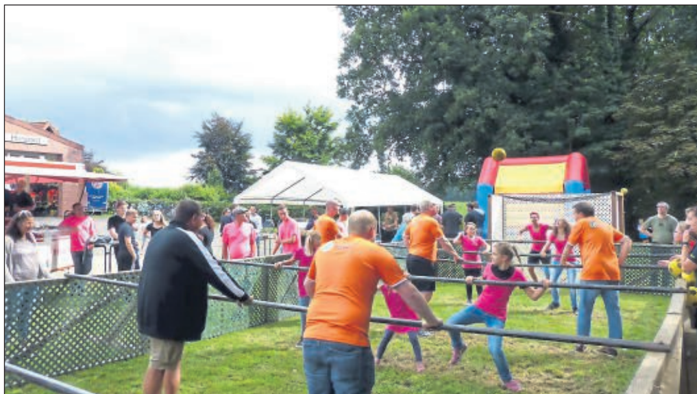
Die „Prinzhöfter Prinzessinnen“ fighteten in grellen Outfits nach Kräften, so auch hier – im Menschenkicker-Match gegen das „Team Thöle“.